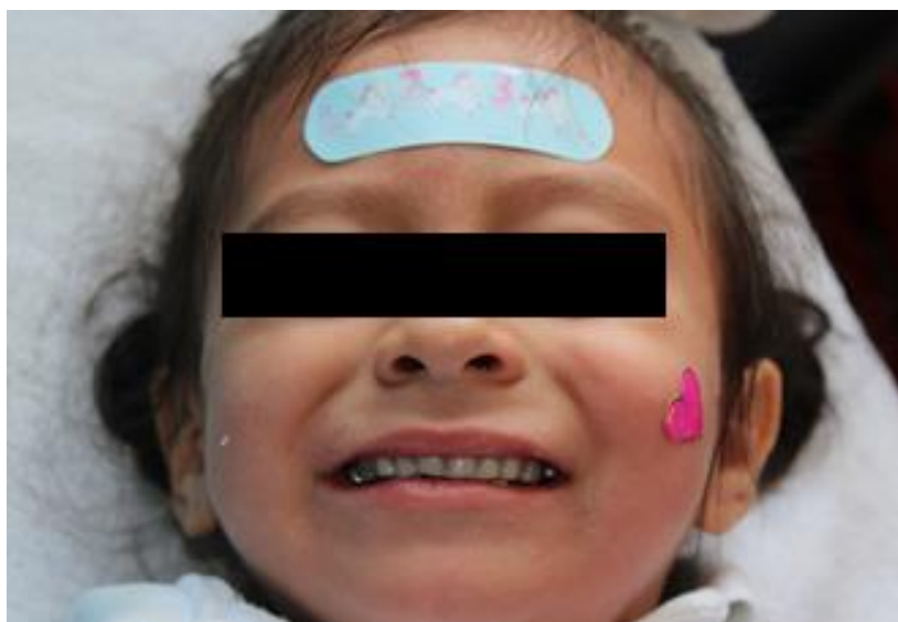
Figura 5. Apariencia final del paciente