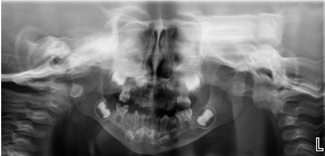
Figura 2. Ortopantografía. estructuras simétricas, fórmula temporal completa, fórmula permanente completa, restos radiculares de órganos dentarios

Por parte del servicio de hematología se solicita biometría hemática de padres y hermano de la paciente para descartar que se trate de una trombocitopenia familiar, debido a que la madre tuvo antecedentes de trombocitopenia.