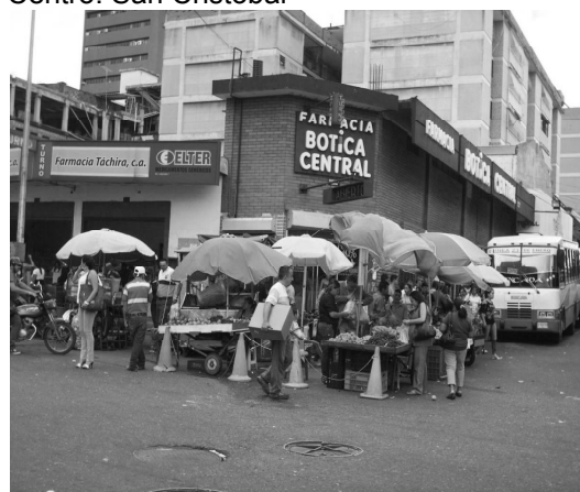
Foto 4. Vendedores Ambulantes. Sector Centro. San Cristóbal