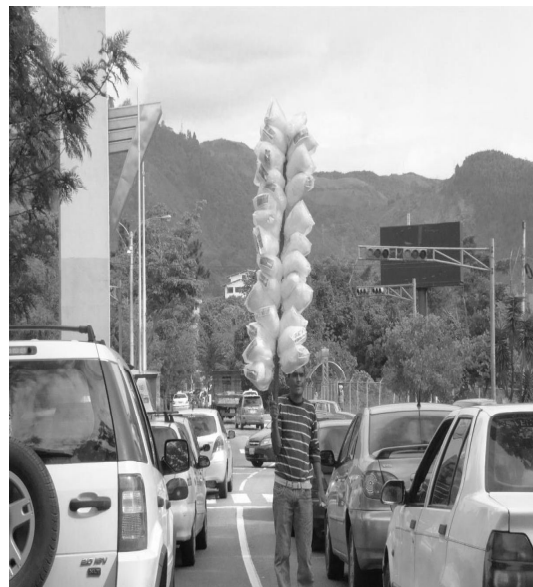
Foto 1º. Vendedor Ambulante ocasional. Av.19 de Abril. San Cristóbal

En las incursiones exploratorias por esta ciudad fronteriza 2 se han inventariado, a grandes rasgos, diversas modalidades que describen las ocupaciones y apropiaciones informales. Algunas son imperceptibles a primera vista, otras forman parte de los visibles actos de intervenciones espontáneas que en muchos casos trastocan la cotidianidad de los habitantes. Unas responden a las necesidades humanas, localizados en aisladas zonas del hábitat precario y de alto riesgo; en otros sectores se constatan las inducidas invasiones de espacios públicos y privados que responden a sectoriales intereses políticos y/o económicos llegando en algunos casos a configurar organizaciones espaciales micro-locales que emulan los modelos de la formalidad urbana.