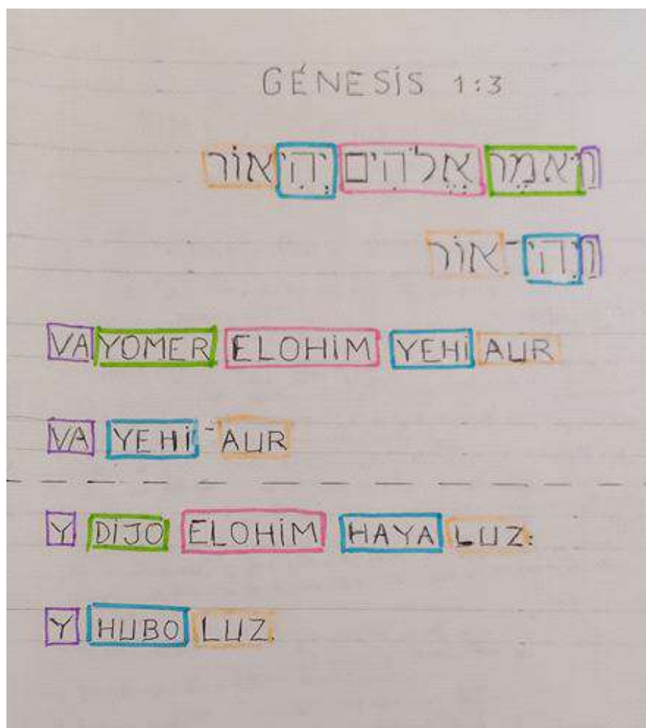
Figura 3. Génesis 1:3