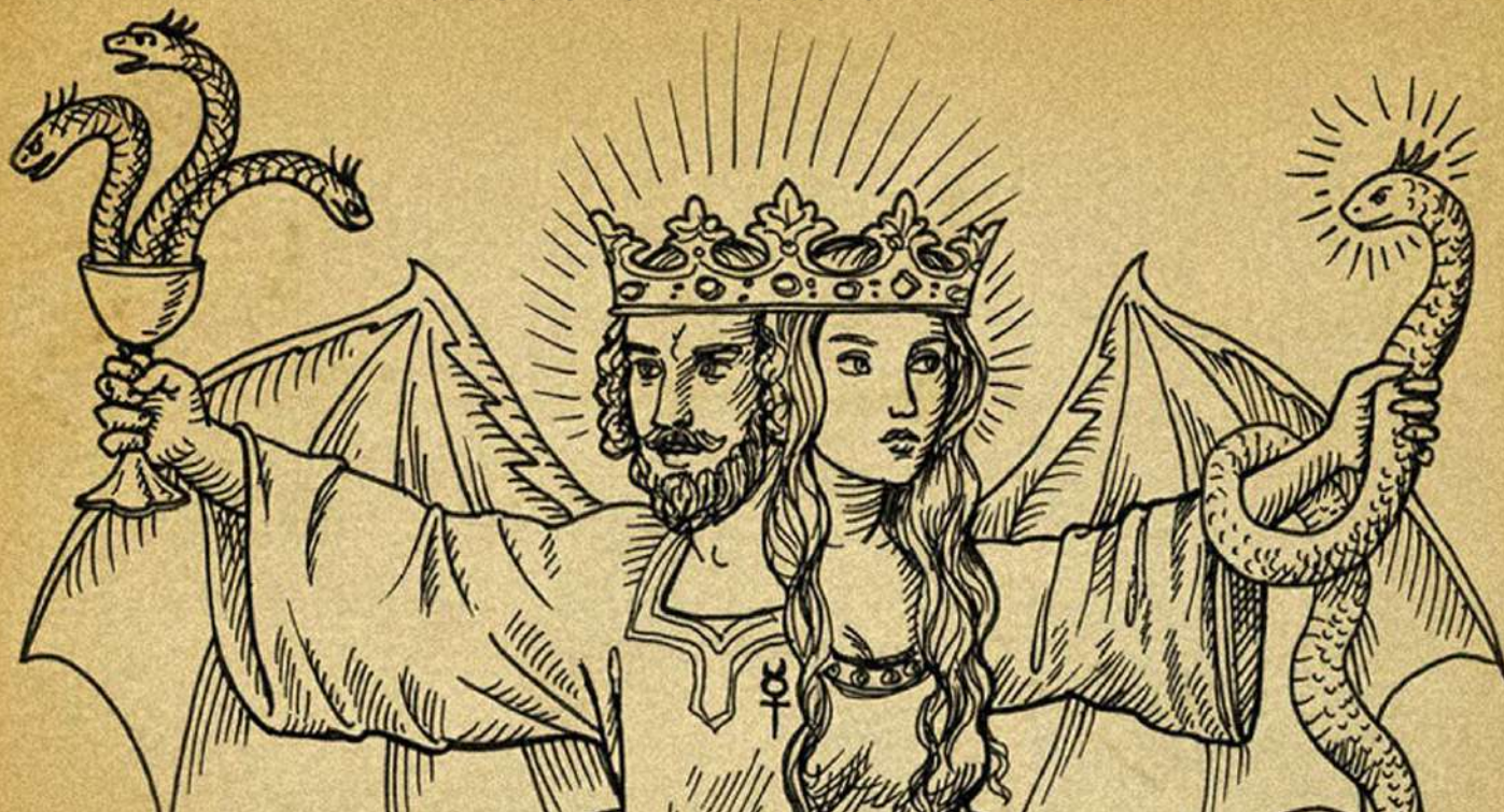
Rebis / grabado del Azoth of the Philosophers de Basilius Valentinus / 1613 / detalle.

Recibido: 16-06-2023 Aceptado: 18-08-2023