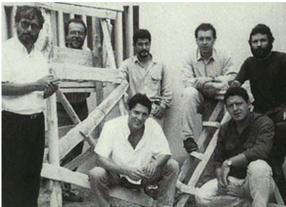
Grupo de Tovar 1996