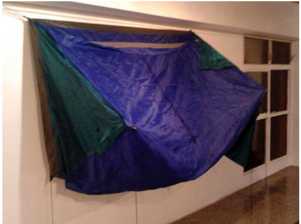
Serie Inestables. Medidas variables 2015 Diego Vivas