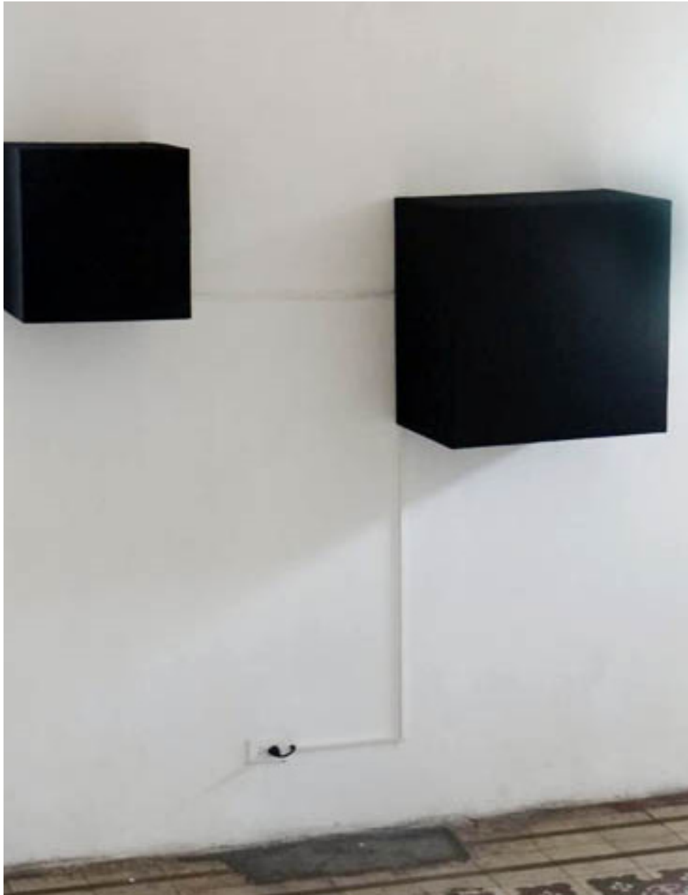
Juan Carlos Briceño. Medidas variables. 2014 Obstinati N° 1. Arte sonoro