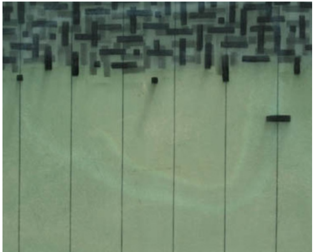
Jesús Guerrero “Otra Galaxia” 2011 Carbón y acrílico sobre lona 190 x 260 cm