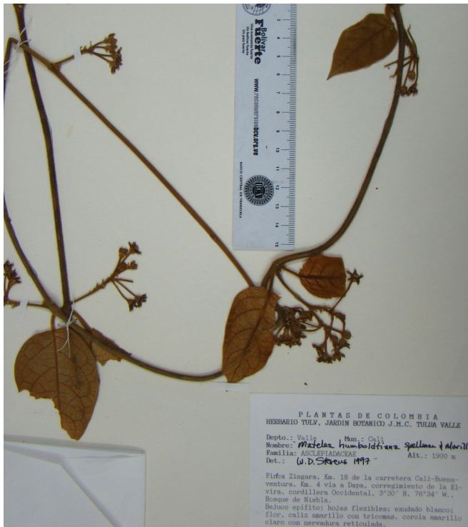
FIGURA 3. Lachnostoma caucanum Morillo. (J Giraldo-Gensini & Agredo, 648 MO).

TIPO: COLOMBIA: Departamento Valle del Cauca, municipio Cali, Km 18 de la vía Cali-Buenaventura, Km 4 vía Dapa, 3°30'N. 76° 34'W., 1900