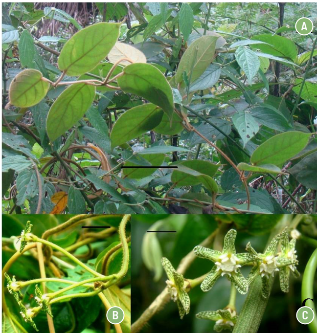
FIGURA 2. Lachnostoma bricenoi Morillo. A) Vista lateral de una rama joven con hojas, en su ambiente natural. B) Vista lateral de una inflorescencia mostrando dípteros que visitan las flores. C) Vista frontal de una inflorescencia, mostrando corola, segmentos de la corona y cara dorsal del ginostegio. Escalas: A: 8 cm, B: 10 mm, C: 5 mm.

ascendentes; lóbulos del cáliz castaños en la mitad apical, angostamente ovados, obtusos, 2,7-3 x 1,2 mm, con un coléter en cada axila; corola campanulada o anchamente subinfundibuliforme, 13-15 mm de diámetro, tubo ca. 4,5 mm largo, en flor al natural 17-18 mm de diámetro, y tubo 5-5,2 mm largo, y lóbulos crema con retículo verde, 6,9-7,7 x 4,5-5 mm, angostamente ovados u oblongo-ovados, asimétricamente obtusos, con frecuencia marginalmente recurvados; porción visible de los segmentos de la corona curvado-bilobada, 1,7-1,8 mm largo, 2 mm ancho apical, con tricomas curvos en la base adaxial, lóbulos divergentes, 0,9- 1 mm largo; ginostegio 3,7-4 mm de diámetro, cabeza estilar blanca, levemente cóncava, anteras 1,7-1,8 mm ancho entre alas; polinios angostamente ovoideos y lateralmente comprimidos, 0,65 x 0,38 mm, caudículas cerca