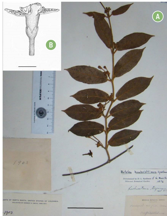
FIGURA 5. Lachnostoma sanctae-martae Morillo. (H. Smith, 1903 MO). A) Espécimen tipo en el herbario NY. B) Vista lateral de la flor. Escalas A: 5 cm, B: 2 mm (H. Smith 1903 en MO, NY, U).

te redondeada o levemente subcordada, 5-7,8 x 2,4-3 cm, con 4 coléteres en la base. Inflorescencias cimas racemiformes o más frecuentemente bifurcadas, 5-8 floras, cuando bifurcadas cada rama con inflorescencias parciales helicoidales sub-umbeliformes; pedúnculo + raquis 7-11 mm largo, brácteas lineares, 0,5-1 mm largo, pedicelos 17-28 mm largo. Flores ascendentes; lóbulos del cáliz angosto-ovados, 1,9-2,1 x 0,9-1 mm, agudos, abaxialmente pubérulos, ciliados, con un coléter por axila, alcanzando la mitad o menos de la mitad del largo del tubo corolino; corola subtubular o muy angostamente subhipocraterimorfa, 11-13 mm de diámetro, tubo 4,2-4,5 mm largo, aprox. 3-3,2 mm de diámetro en la garganta, lóbulos patentes, cremosos con retículo de nervios verdes, asimétricamente ovados, obtuso-emarginados en el ápice, 4,4-4,5 x 2,5-2,7