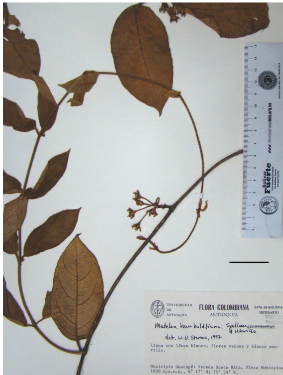
FIGURA 1. Lachnostoma antioquense Morillo. (Especimen Tipo: Roldán & Betancur, 885 MO). Escala 4 cm.

Trepadora de longitud desconocida. Hojas decusadas, pecíolos 1-2,1 cm largo, láminas ova-do-elípticas a oblongo-obovadas, cortamente acuminadas, base angostamente redondeada o levemente subcordada, 7-10 x 2,6- 4,9 cm, con 4 coléteres en la base. Inflorescencias cimas helicoidales escorpioideas, 5-7-floras; pedúnculo + raquis 7-13 mm de longitud; brácteas lineares, 0,9-1,5 mm largo, pedicelos 11-15 mm largo. Flores ascendentes; lóbulos del cáliz oblongo-ovados, 3-3,2 x 1,4-1,5 mm, agudos, densamente pubescentes en la cara abaxial, con un coléter por axila, tan largos como el tubo corolino; corola angostamente campanulada, 11,5-12,5 mm de diámetro, tubo 3,3-3,5 mm largo, 3,5-3,8 mm de diámetro en la garganta, abaxialmente glabro, lóbulos amarillos con retículo de nervios verdes, en posición natural 4,3-4,6 x 3-3,5 mm,