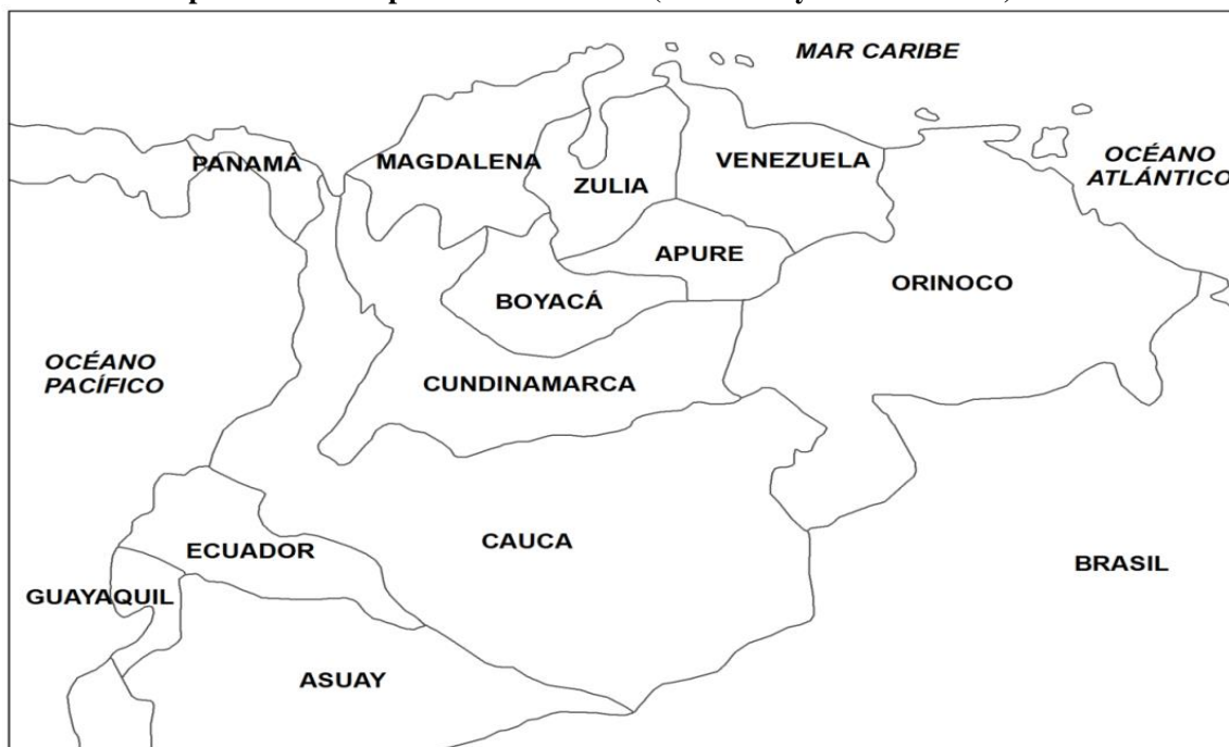
División política de la República de Colombia (Venezuela y Cundinamarca) 1821 a 1830