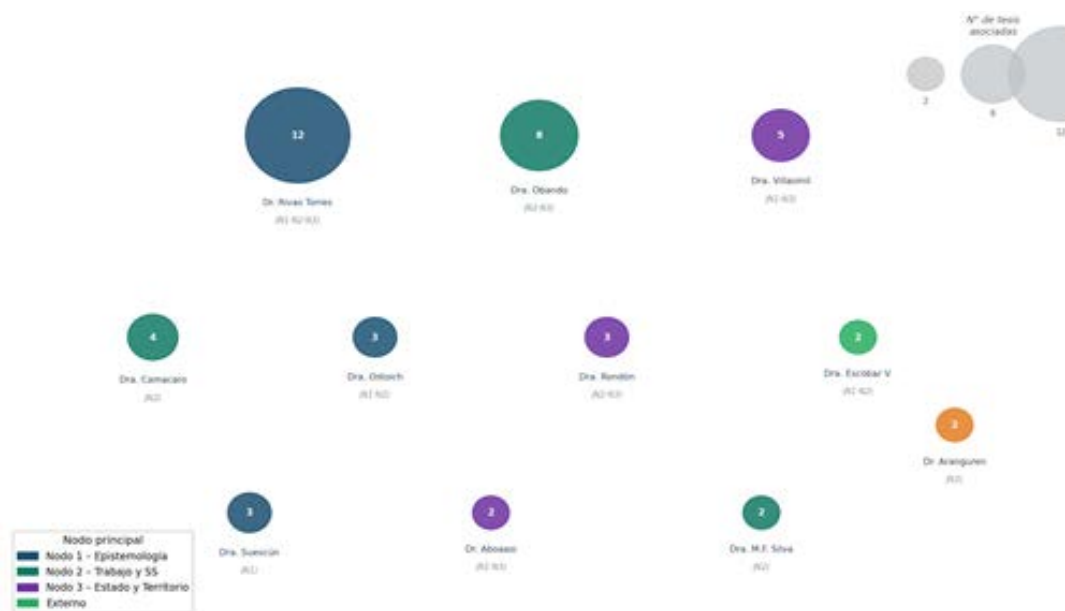
Figura 3. Participación de tutores por Nodo Estratégico. El número en cada burbuja indica producciones asociadas