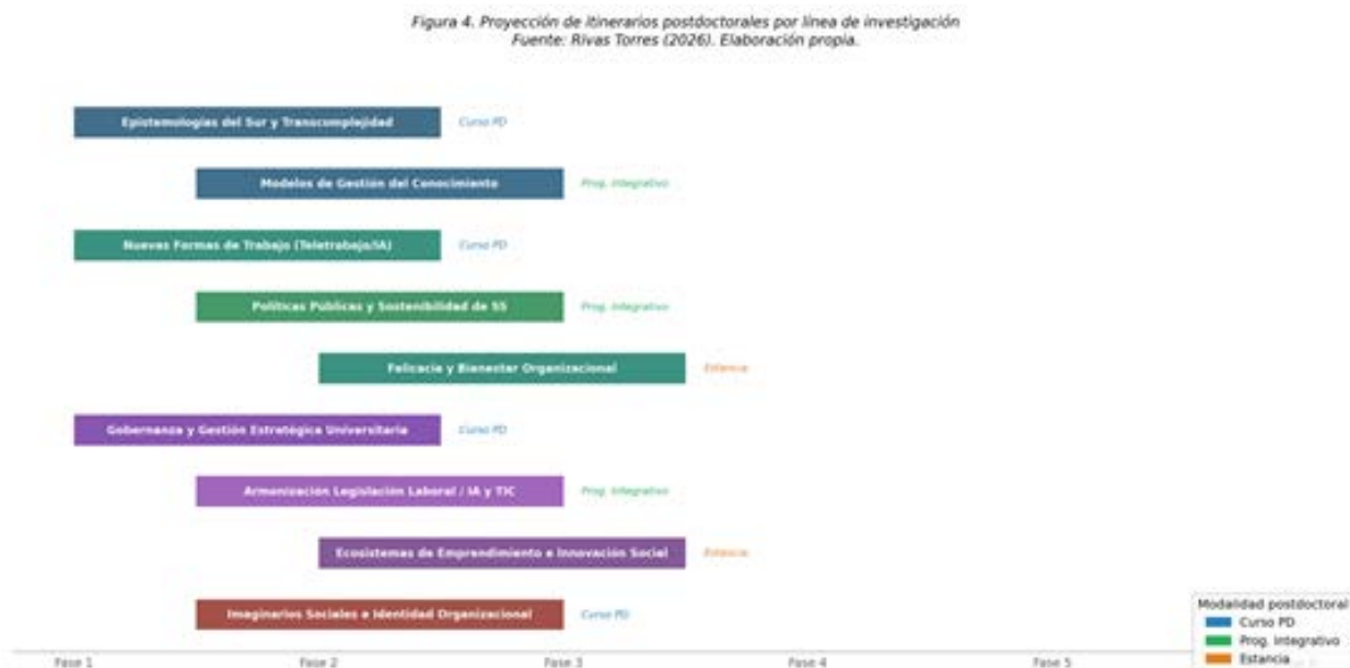
Figura 4. Itinerarios postdoctorales proyectados por línea de investigación

La Figura 4 representa los itinerarios postdoctorales proyectados para cada una de las nueve líneas matrices, diferenciando entre cursos, programas integrativos y estancias de investigación. Las tres modalidades tienen lógicas distintas: el curso postdoctoral es la más tradicional —una actividad formativa de alta intensidad—; el programa integrativo supone que el egresado produce algo durante la estancia, un modelo que puede validar en su propia institución o un conjunto de artículos que amplíen los hallazgos de la tesis; la estancia, en cambio, es más abierta y está pensada para investigadores que ya tienen un proyecto claro y necesitan tiempo, interlocutores y bibliografía.